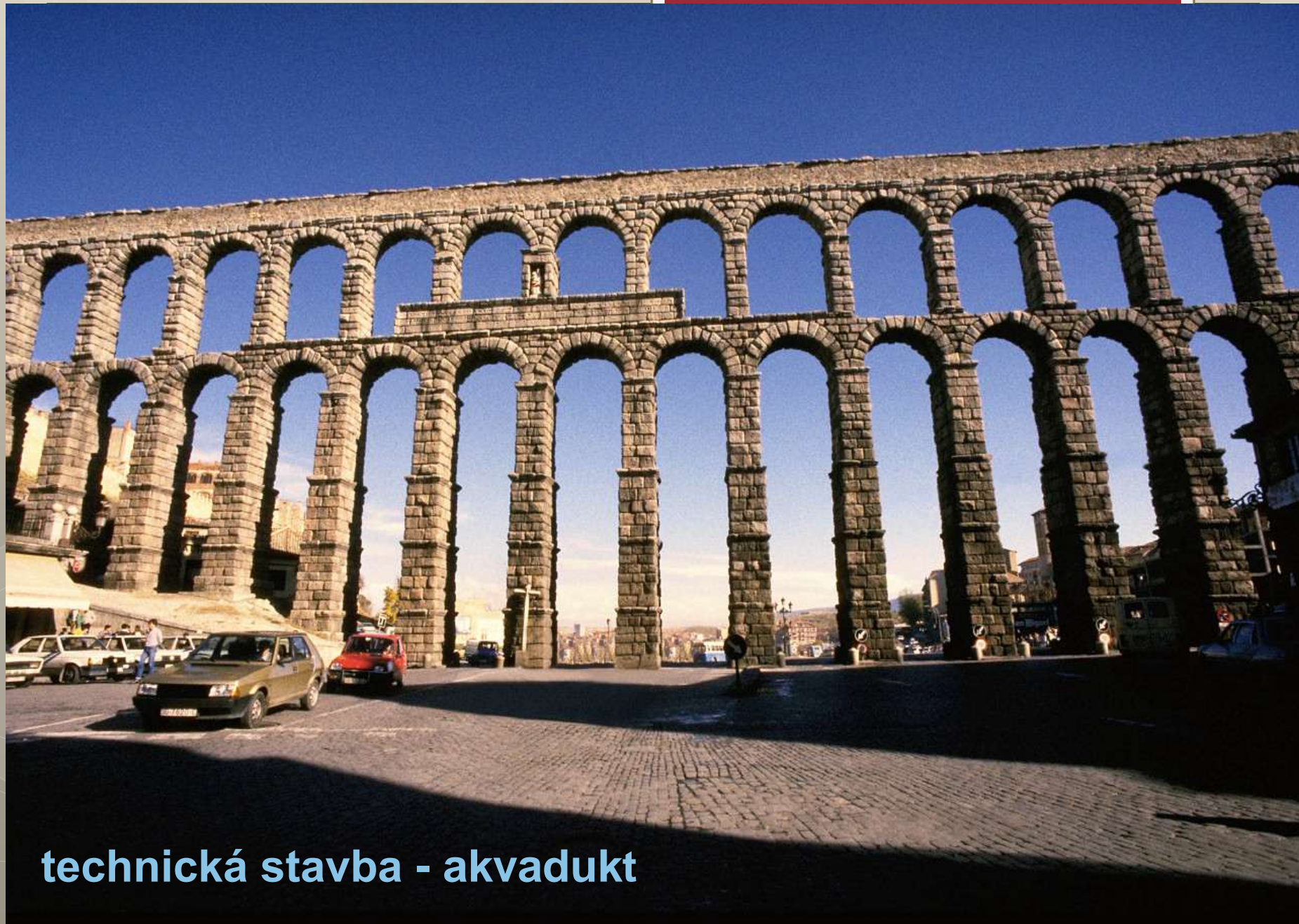
technická stavba - akvadukt